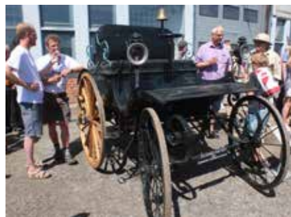
Hammelvognen fra 1888 menes at være verdens ældste kørende bil...