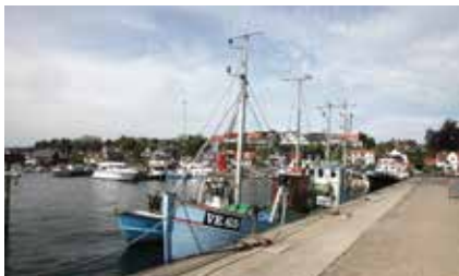
En anden Skærbæk, nemlig Skærbæk ved Kolding, som vi besøgte på vejen hjem...