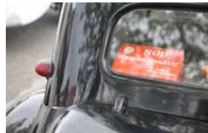
Fra Skibbroen i Tønder, hvor vi holdt en god lang pause under køreturen.