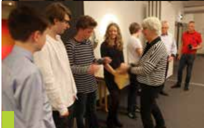
Repræsentanter for TADs Ungdomsafdeling hjælper til med præmieuddelingen