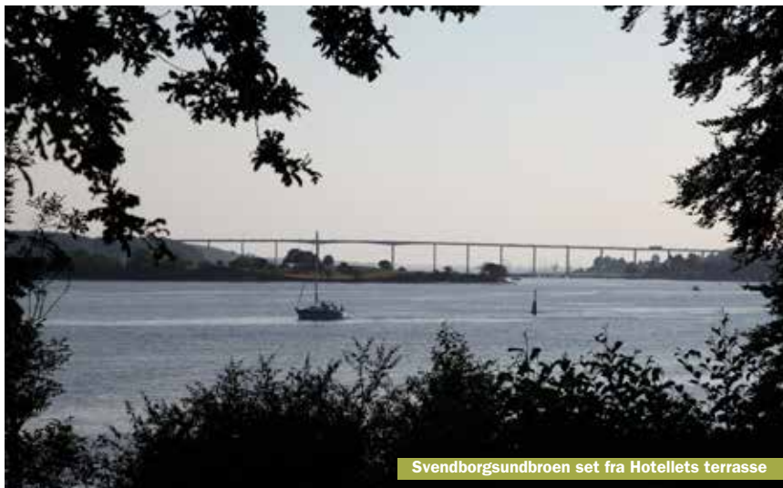
Svendborgsundbroen set fra Hotellets terrasse