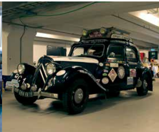
Samling i et kedeligt parkeringsanlæg i København. Så snart vi havde fået kontakt med folkene, gik der ikke mere end 30 sekunder før vi blev udstyret med en glas vin!