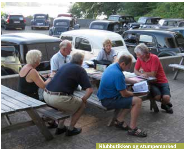
Klubbutikken og stumpemarked