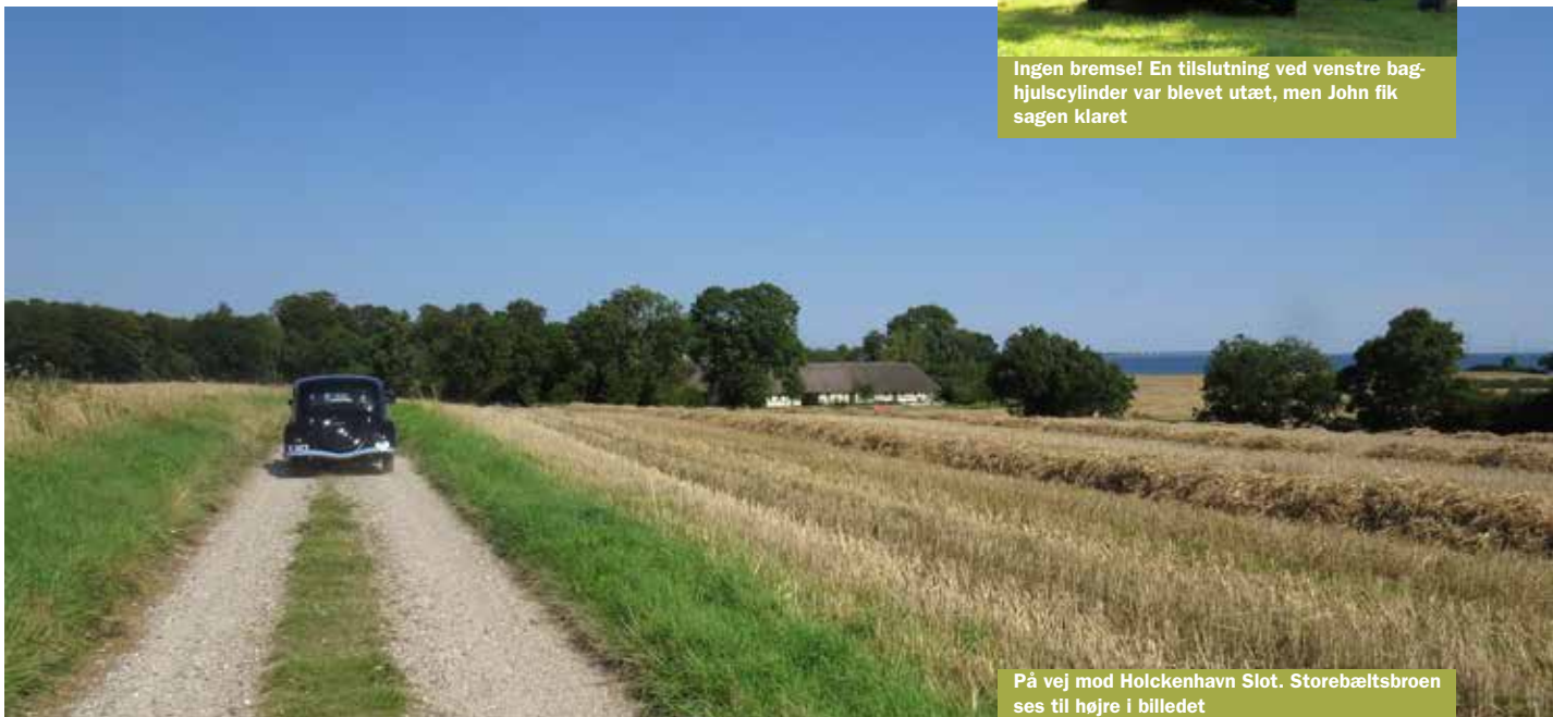
På vej mod Holckenhavn Slot. Storebæltsbroen ses til højre i billedet