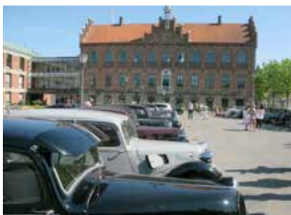
Lineup og frokost på Torvet i Nyborg med det fine rådhus