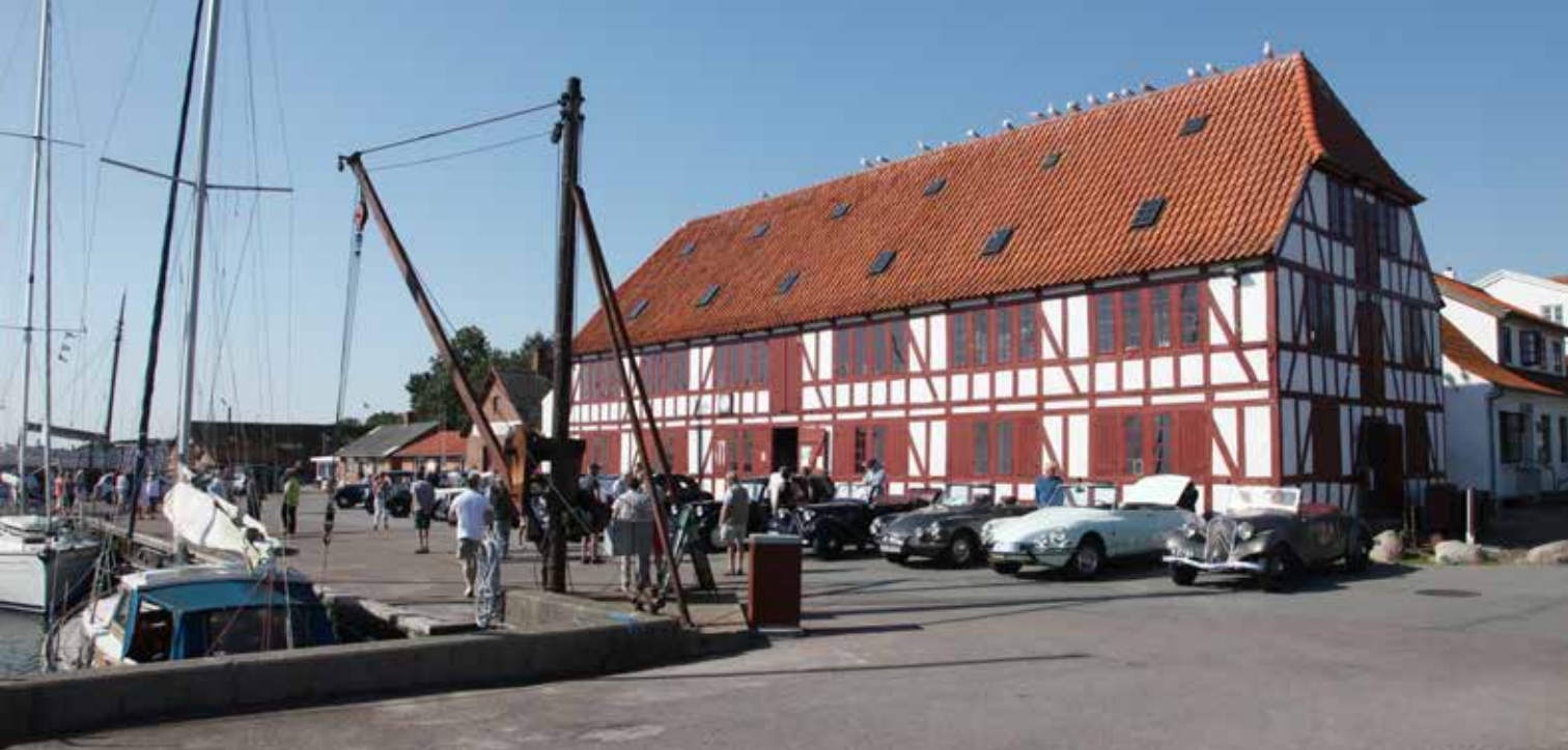
Lundeberg Havn – romantisk idyl for alle pengene...