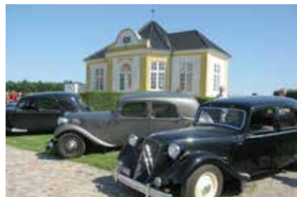
En malerisk afslutning – samt kaffe og kage – på Valdemar Slot