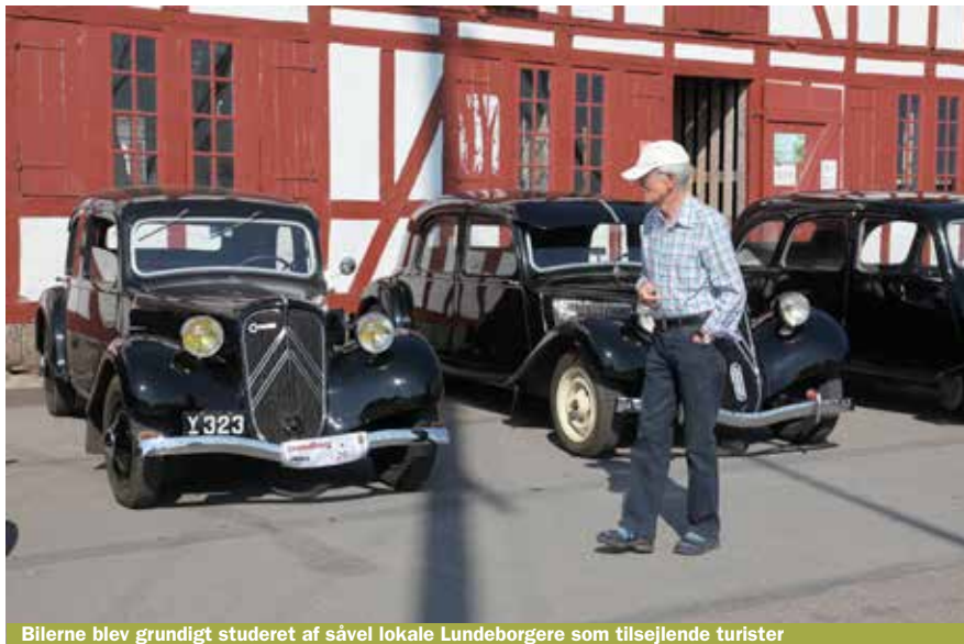
Bilerne blev grundigt studeret af såvel lokale Lundebergere som tilsejlende turister