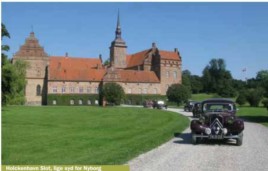
Holckenhavn Slot, lige syd for Nyborg