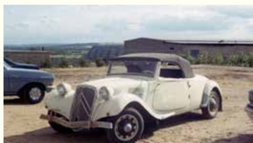
Billedet her er fra 1970 – bemærk de spøjse kofangerhorn - de sad der også i 1947...