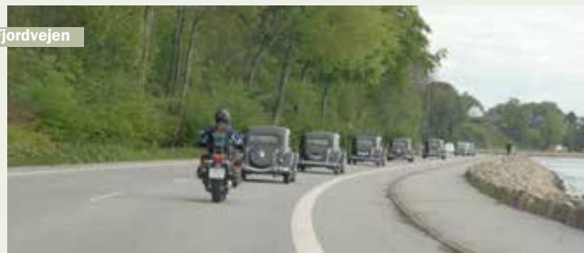
Flot kortege på Fjordvejen