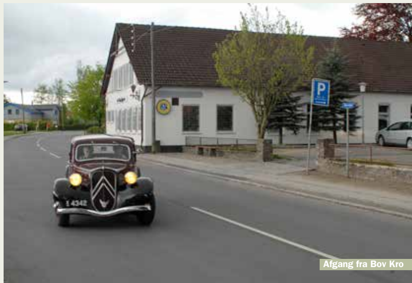
Afgang fra Bov Kro