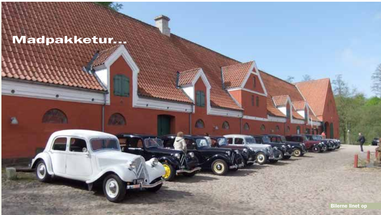
Bilerne linet op

Lørdag den 12 maj mødtes vi på Tørring Mølle hvor vi fik morgenkaffen i en af de historiske bygninger, hvor der stadig er et lille elkraftværk drevet af en vandturbine.