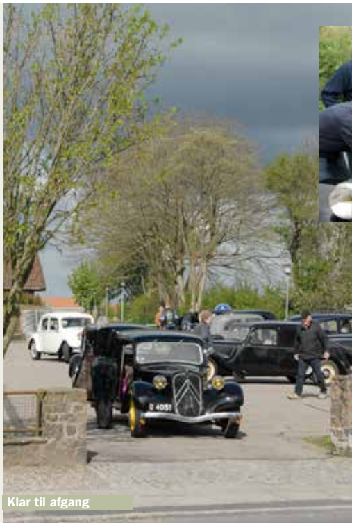
Klar til afgang