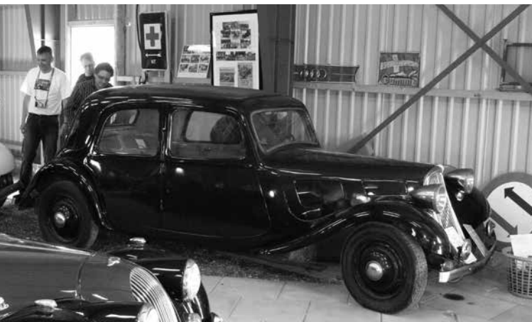
Utrolig fin og helt usædvanlig original 7B fra 1934.