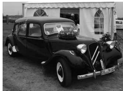
Herr Donners 11 Commerciale - og derunder en meget lang Folkevogn på markedspladsen...