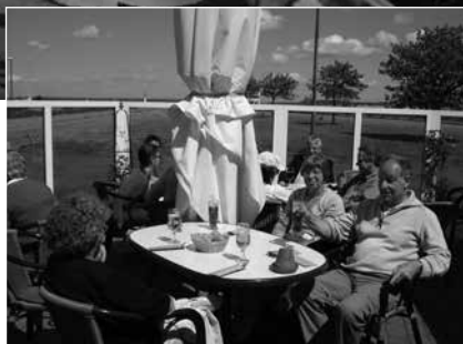
Frokost ved Gelting

<< Var håndbremsen nu forsvarligt trukket?