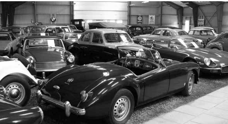
MG'er alle vegne

Ikke et øje var tørt hverken hos de få andre bilister på færgen eller hos tractionisterne.. Vi måtte alle ud og op på færgen for at fotografere. Efter ti minutter var vi alle landet sikkert på Bogø og så gik turen videre mod nord til Kalvehave, Præstø, Faxe og til Køge. Her skiltes flokken og alle kom såvidt vides sikkert hjem - incl. undertegnede i den nyrestaurede 38 Normale som inden dagen var omme stod på den anden side af 300 km - og alt gik næsten som smurt. /pjj