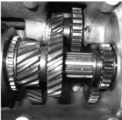
Stemmingsfoto fra redaktørens garage, hvor der forleden blev lagt låg på gearkassen...