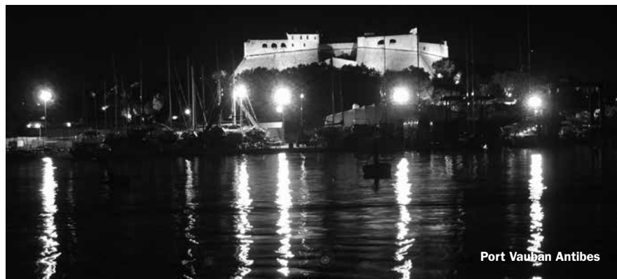
Port Vauban Antibes

I er velkomne til at kontakte overtegnede for uddybende kommentarer / hjælp. mob. 30546477.