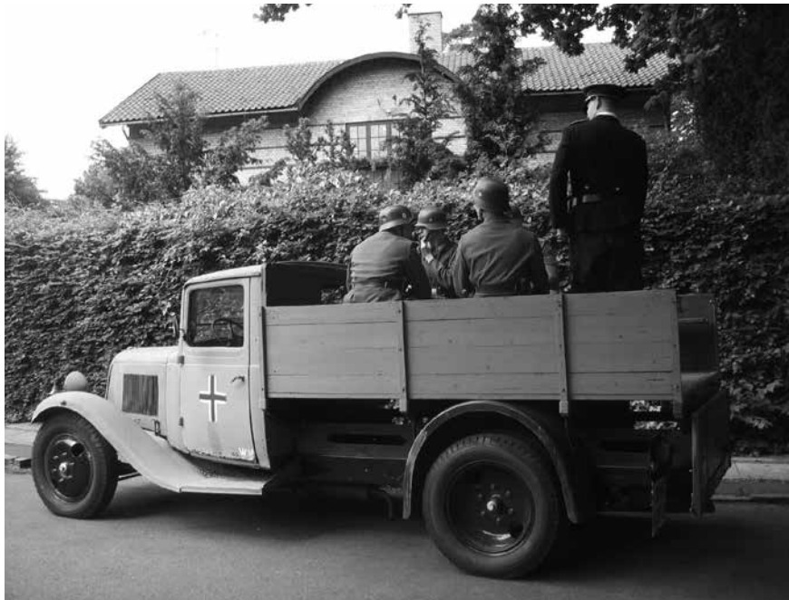
To karakteristiske udstyrsvariationer for T 23 - øverst med rigning og feltkøkken ved filmoptagelser på Refshaleøen i marts - nederst med lys grå lakering og åbent lad som tysk transportvogn.