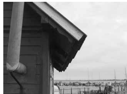
Den oprindelige udskårne vindskede afslører skuret som det gamle læskur