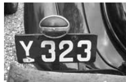
Nederst en gammel kending, Y323 viste sig for første gang efter total renovering med Jan Bischoff og Bodil bag rattet.

ter, som rummer både idrætsfaciliteter med svømmehal, restaurant, mødelokaler m.v. samt en nybygget ferieby - ideel til afvikling af træf som vores.