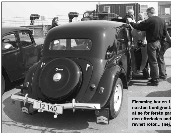
Flemming har en 11 Sport fra 1950, næsten færdigrestaureret og vi fik bilen at se for første gang. desværre måtte den efterlades undervejs på grund af en revnet rotor... (nej, ikke motor)...

Frokosten blev indtaget hjemme hos Flemming - naturligvis udenfor i det dej- lige solskinsvejr!