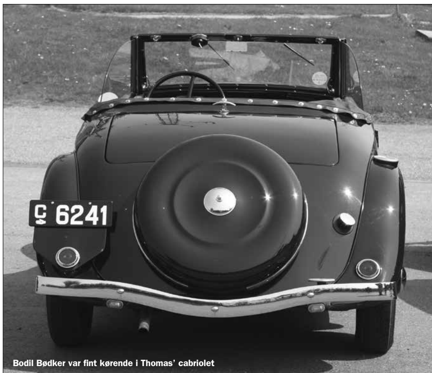
Bodil Bødker var fint kørende i Thomas' cabriolet