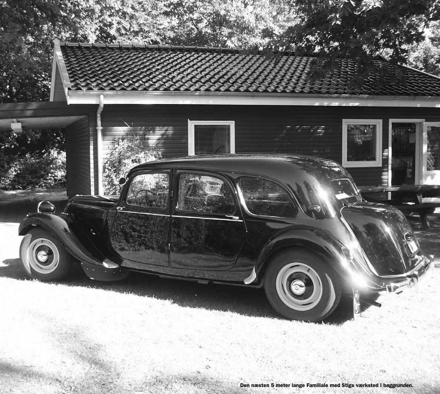
Den næsten 5 meter lange Familiale med Stigs værksted i baggrunden.