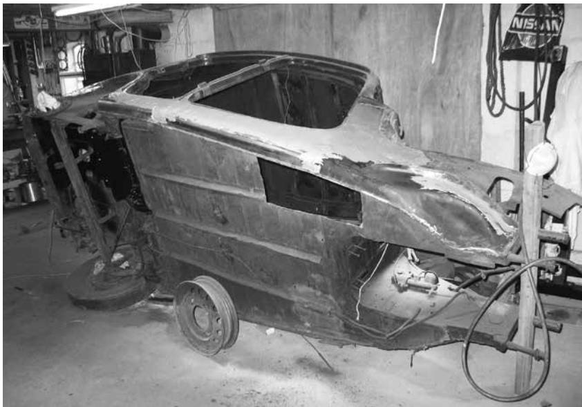
Jørgen Kroghs 7C Eco fra 1940.