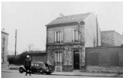
Et par billeder af Normalen, mens familien boede i Frankrig. Bilen er parkeret foran borgmesterkontoret i en landsby i nærheden af Reims.