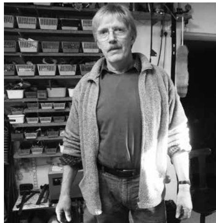
Stemningsbilleder fra Valby.