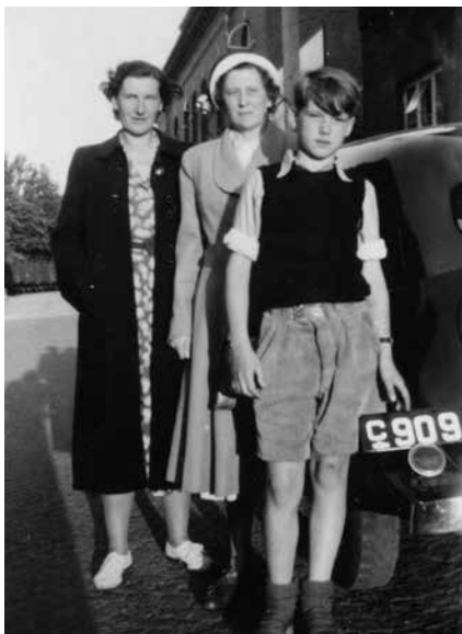
Normalen igen - her med C909. Familien beholdt bilen helt frem til omkring 1957.