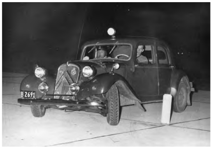
Ét af de sidste fotos af Citroënen med B2691, Evald og »Hansen« ved Trelleborgløbet i 1957. Til højre er nummeret gået videre til en Morris 1000 - portrættet er fra 1958, lejligheden Caltex Economy Test.