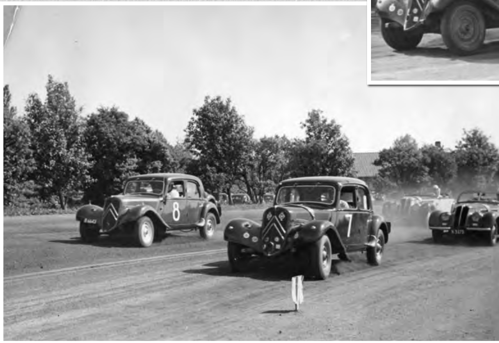
Begivenheden er DM 1954 på Amager Travbane hvor Evald vandt 1. heat, men blev i 3. heat snydt for sejren på grund af en knækket plejstang. Han kunne dog gennemføre løbet. Gennemsnitshastighederne på den ca. 1,2 km lange rundbane lå godt over 90 km/t.