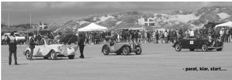
- parat, klar, start....