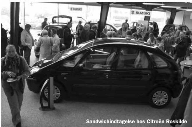
Sandwichindtagelse hos Citroën Roskilde