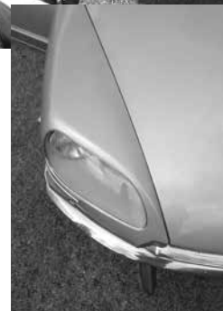
Orla Christensens utroligt flotte DS21 Pallas er endelig blevet færdig og vakte stor opsigt - det er tydeligt at de fleste af os også har et DS-gen!