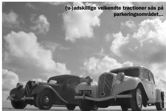
(u-)adskillige velkendte tractioner sås på parkeringsområdet...