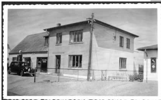
Den første 7C foran fars værksted

De første møder finder sted: Fredag den 10. september og fredag den 8. oktober.