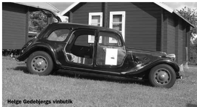
Helge Gedebjergs vinbutik