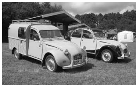
Toprestaurede 2CV'er fra Sverige