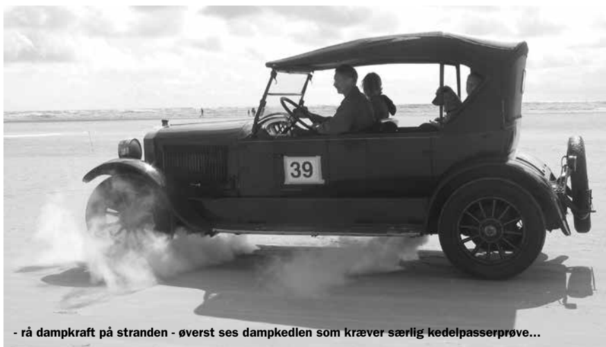
- rå dampkraft på stranden - øverst ses dampkedlen som kræver særlig kedelpasserprøve...

Foruden de deltagende havde arrangørerne inviteret til at så mange som muligt mødte op på stranden med deres gamle biler. Så også på parkeringsom-