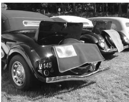
Gulvtæppetørring på cabrioletterne