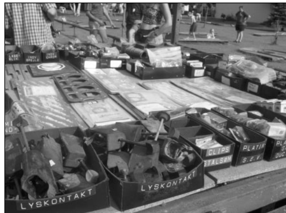
Stumpemarkedet lørdag eftermiddag. Der er ingen problemer - næsten alt kan fås. Det er nok sværere at sælge noget. Lastbilen er Benny Sørensens.