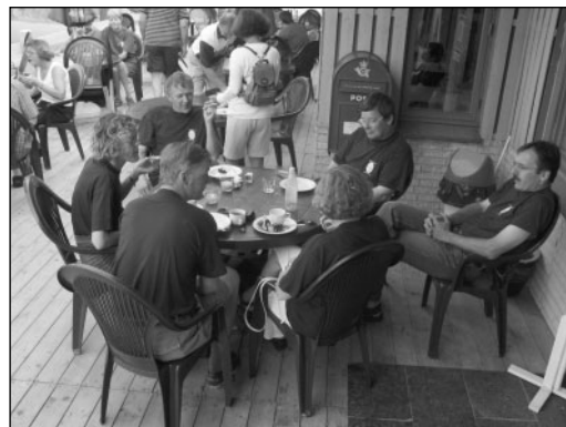
En stor del af træfgruppen