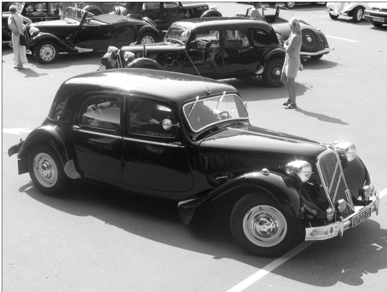
Tung og massiv - og alligevel majestætisk elegant. En af de mange 15six, der kom fra Holland, foto- graferet ved Himmelbjerget. Bagved ses flere an- dre eksotiske modeller...